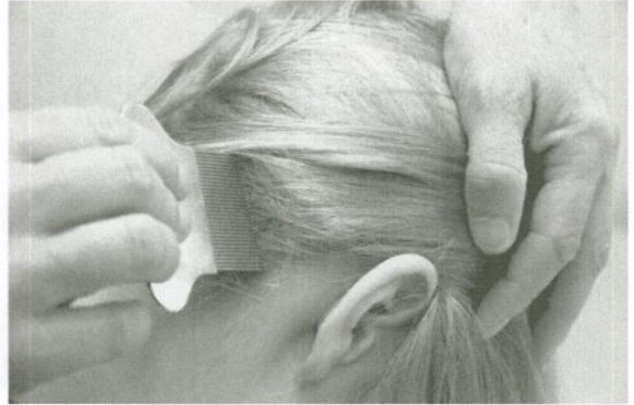
Kam het haar met een fijntandige kam boven een wit papier of de wasbak.