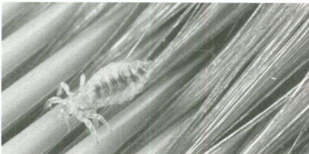
Een hoofdluis op een kam.

De volwassen luis is een grijsblauw beestje van ongeveer 3 millimeter groot. Nadat hij bloed opgezogen heeft, is hij roodbruin. De eitjes, neten, zien eruit als grijswitte puntjes en kleven aan de haren. Ze zijn lastig te verwijderen. Neten die dichtbij de hoofdhuid zitten, bevatten eitjes. Zolang deze volle neten in het haar zitten, blijven er luizen geboren worden. Zitten ze een paar cm van de hoofdhuid vandaan, dan zijn ze uitgekomen en leeg. Als het haar groeit, komen de lege neten steeds verder van de hoofdhuid af te zitten.