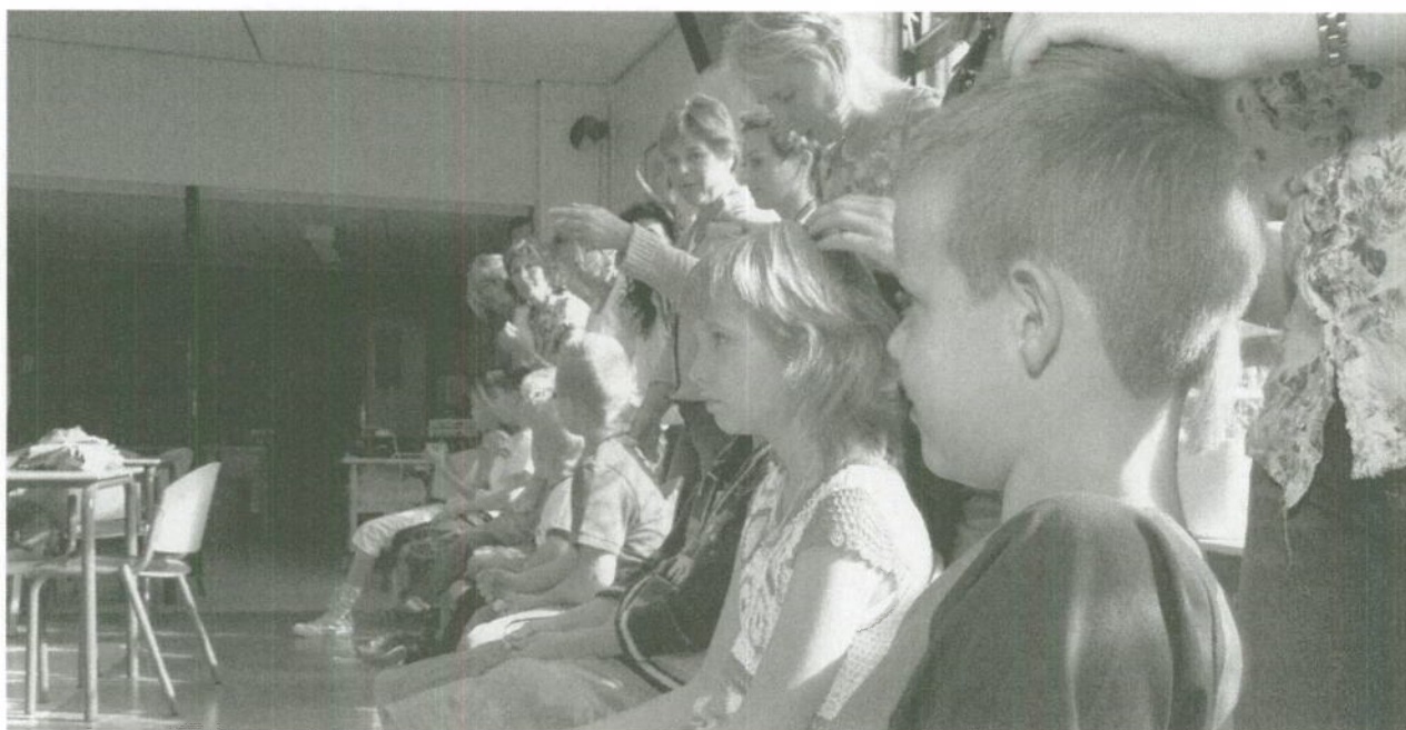
Een ouderwerkgroep kan op school de kinderen regelmatig controleren.

Niet alle ouders willen dat hun kind gecontroleerd wordt door een andere ouder. De school kan dit ondervangen door de luizencontrole in het schoolreglement op te nemen. Daarnaast kunnen ouders én kinderen gestimuleerd worden om regelmatig te controleren op hoofdluis, en hoofdluis te melden aan de school. Als een kind hoofdluis heeft, is het verstandig om alle kinderen uit die groep een informatiebrief over hoofdluis mee naar huis te geven.