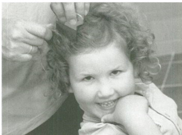
De uitkammethode is het meest natuurlijke middel tegen hoofdluis

De uitkammethode is effectief maar biedt geen 100 % 'garantie'. Het voordeel is dat u geen chemicaliën gebruikt.