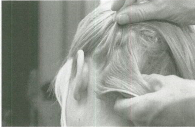
Als u op hoofdluis controleert, kijk dan goed tussen de haren.